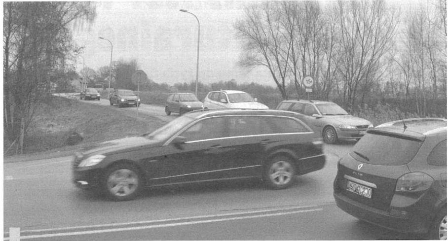
Na krajowej 44 jest bardzo niebezpiecznie. Na skrzyżowaniu ulic Zatorskiej z Porębską i Jezioro często dochodzi do kolizji i wypadków.

(...) Na terenie Gminy Oświęcim przykładami szczególnie problematycznych miejsc jest skrzyżowanie z drogą powiatową nr 1897K w miejscowości Zaborze, gdzie dochodzi do licznych zdarzeń drogowych (w tym także ze skutkiem śmiertelnym) oraz przejście dla pieszych w rejonie skrzyżowania z ul. Osiedlową, kwalifikujące się do zabudowy znaku D-6 z ostrzegawczym sygnałem świetlnym. Mając jednak na uwadze panujące natężenie ruchu oraz porównywalne warunki drogowo-