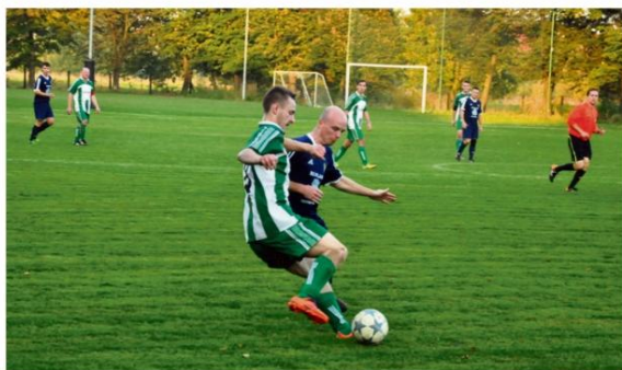
LKS Rajsko zadebiutuje na piątoliigowym szczeblu.

To będzie wyjątkowy sezon dla wszystkich kibiców piłkarskich w Rajsku. Miejscowy LKS zadebiutuje bowiem w rozgrywkach ligi okręgowej.