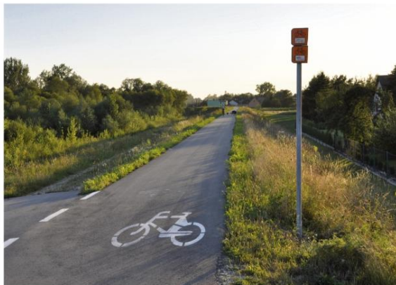
Fragment Wiślańskiej Trasy Rowerowej biegnącej przez naszą gminę.

szlakach turystycznych w naszym regionie. Oznaczonych tras jest jednak niewiele. W dodatku sporo amatorów rekreacji na rowerze poprzestaje na sprawdzonych, najbliższych drózkach i ścieżkach, mimo że w naszej okolicy nie brakuje urokliwych miejsc, w które można dotrzeć jednośladem.