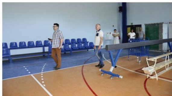
Samorządowcy odwiedzili nową szkołę i salę gimnastyczną 3 sierpnia.

Budynek nowej szkoły w Porębie Wielkiej szykuje się na przyjęcie uczniów. W sobotę, 1 września uroczyste otwarcie, festyn i zabawa, a dwa dni później inauguracja roku szkolnego 2018/2019 w nowych murach.