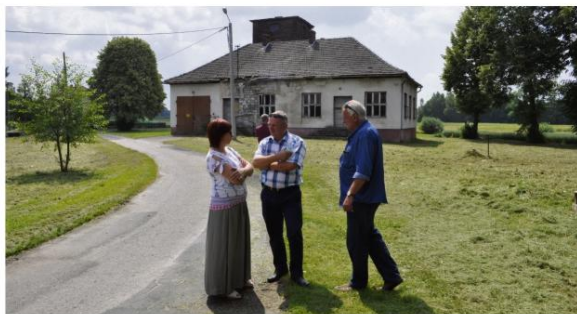
Radni Gminy Oświęcim przed tzw. starą remizą w Dworach Drugich.

Radni i sołtysi objechali 11 czerwca wszystkie wsie, żeby przedstawić sobie nawzajem problemy i zobaczyć je na własne oczy. Rządziej podkreślali dokonania i powody do zadowolenia.